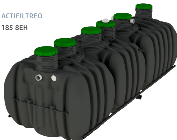
ACTIFILTREO 185 8EH