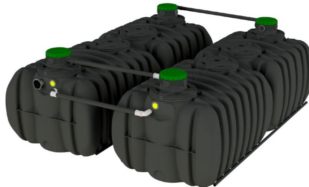
ACTIBLOC® 185 20 EH BI-CUVE