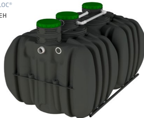
ACTIBLOC® 185 4EH