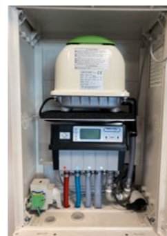
Armoire de commande ACTIBLOC Art. 35989